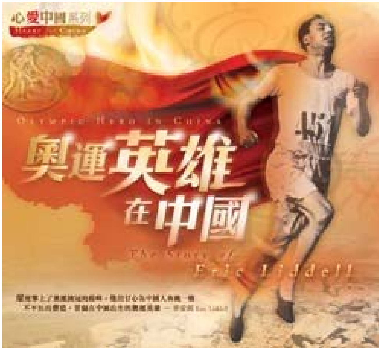
李爱锐 Eric Liddell 1924